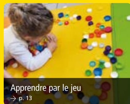
Apprendre par le jeu