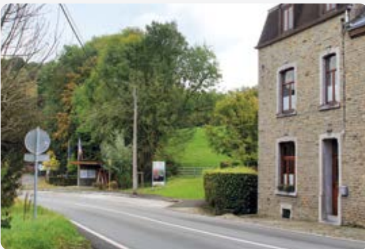
Le même angle de vue en 2021

La prise de vue date vraisemblablement de 1907, il s'agit de l'actuelle place Aimé Tricmont à Limont. A l'époque cet endroit était appelé « Gare de Limont – Chapelle ». Cette gare était le terminus d'une ligne de chemin de fer vicinal venant de Seraing par Rotheux. Sur cette carte postale on distingue les rails qui traversent la chaussée pour donner accès à la remise de la motrice du tram.