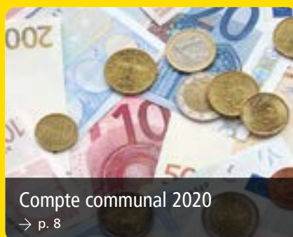
Compte communal 2020